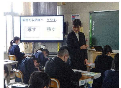
6年 漢字を正しく使えるように