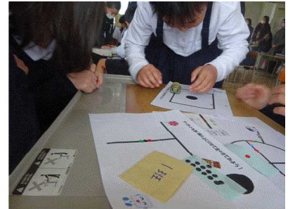
3年 オソボットを動かそう