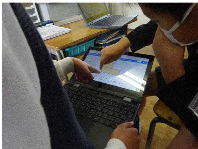
4年 広さの表し方を考えよう