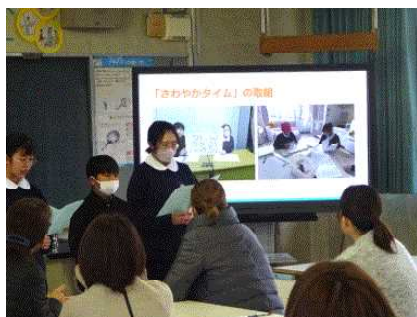
<保健委員会の発表>

お集まり頂いた保護者の皆様に対して、保健委員会の児童より校内での保健活動を報告したり、養護教諭より児童の保健室利用状況等について報告したりしました。今後も健康に気をつけながら安心安全に学校生活を送れるよう、学校保健活動を継続していきたいと思っております。校医の内田先生、ご助言有り難うございました。