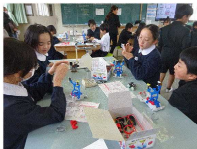
5年 電流がうみ出す力