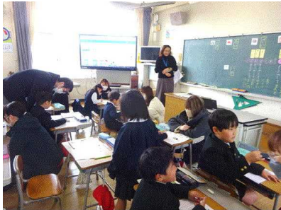
1年 たのしいな ことばあそび

参観日では、各教室で楽しく学んでいる子どもたちの様子をご覧頂けたのではないのでしょうか。今回は、理科(5年)、プログラミング(3年)、学級活動(2年)など、色々な科目を学んでいる様子をご覧頂きました。